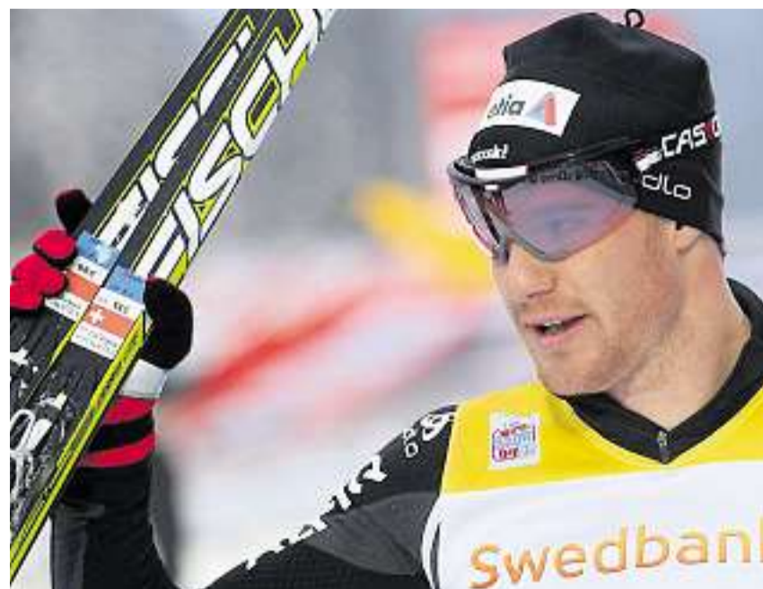
Läuft in einer eigenen Liga: Dario Cologna gelangen innert zwei Tagen gleich zwei Weltcupsiege.

Ski nordisch. – Dario Cologna läuft gegenwärtig allen buchstäblich davon. Beim samstäglichem Sprint über 1,4 km im estnischen Otepää spielte er förmlich mit seinen Gegnern. Ähnlich sah es gestern über 15 km klassisch aus. Cologna ging das Rennen relativ «langsam» an, steigerte sich aber dann von Kilometer zu Kilometer und nahm am Ende allen seinen Konkurrenten 24 und mehr Sekunden ab. Damit hat Dario Cologna auch seine Führung im Gesamtweltcup weiter ausgebaut und dürfte nur mehr schwer von dieser Spitzenposition zu verdrängen sein. (aw) SEITE 15