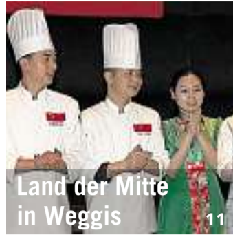
Land der Mitte in Weggis 11

Bote der Urschweiz Schmiedgasse 7, 6431 Schwyz www.bote.ch Redaktion: Fon 041 819 08 11 Fax 041 811 70 37 redaktion@bote.ch Abonnemente: Fon 041 819 08 09 Fax 041 819 08 53 abo@bote.ch Inserate/Anzeigen: Fon 041 819 08 08 Fax 041 819 08 17 inserate@bote.ch