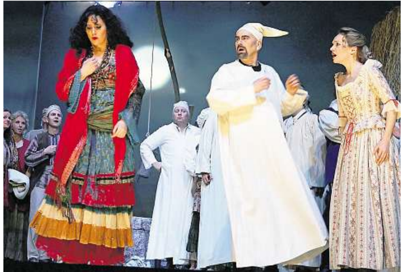
Operette der Irrungen und Wirrungen: In der nächtlichen Schlüsselszene stellt sich heraus, wer Zigeunerbaron geworden ist und wer dessen Favoritin des Herzens ist.