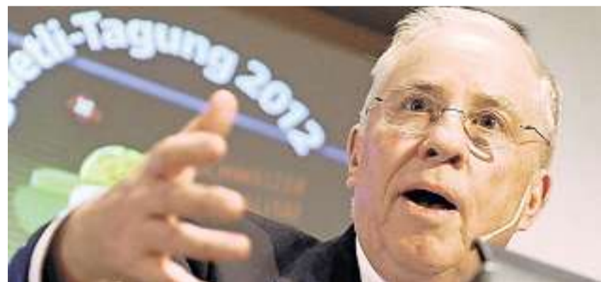
Was war genau seine Rolle? Wirbel um Christoph Blocher.

Zürich. – Wie der Bankangestellte der Zeitung «Der Sonntag» erklärte, habe er die brisanten Bankdaten gar nicht publik machen wollen. Aber SVP-Nationalrat Christoph Blocher habe Druck ausgeübt. Blocher soll eine neue Anstellung versprochen haben, wenn der Datendieb bei Sarasin entlassen würde. (red) SEITE 22