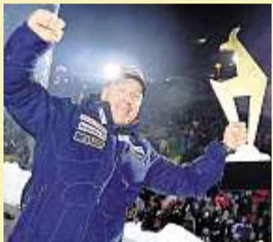
Husarenstück: Didier Cuche strahlte um die Wette.